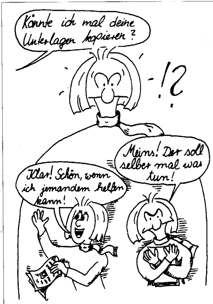
Abb1. Zwei „Seelen“ (=innere Stimmen) in der Studentin

natürlich für unsere Studentin eine Komplikation; und da eine solche innere Pluralität eher die Regel als die Ausnahme darstellt, bedeutet dies eine spannende und spannungsvolle Komplikation für die zwischenmenschliche Kommunikation überhaupt. Ich komme